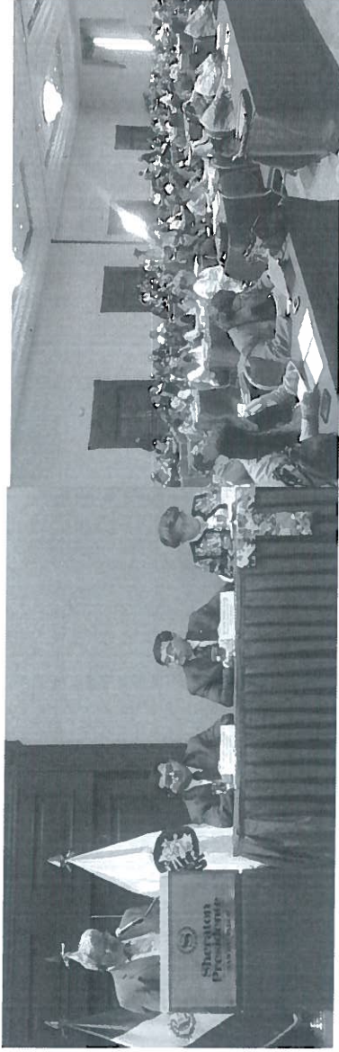
Congreso de Tuberculosis